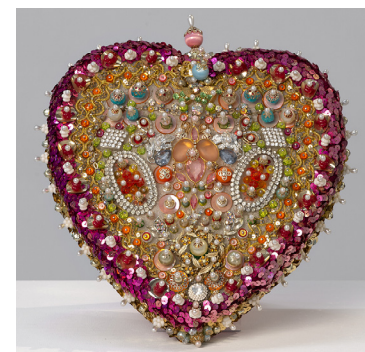
Sarah Pucci Happiness 1980's

perles, paillettes, épingles, mousse, médaillon 28 x 26 x 9 cm Unique