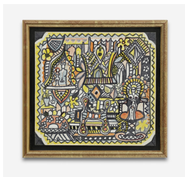
Dorothy Iannone Gift to Mother 1966 ca.

Série work on paper pointe feutre sur papier, cadre cadre 18 x 19 x 1,7 cm Unique