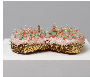
Sarah Pucci Pillow 1980's

perles, paillettes, épingles, mousse, médaillon ø 31 x 6 cm Unique