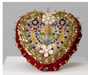
Sarah Pucci Sans titre 1990's

perles, paillettes, épingles, mousse 32 x 29 x 9 cm Unique