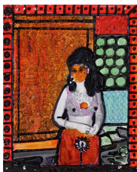
Dorothy Iannone Moving on 1968

pointe feutre sur Polaroid 10,7 x 8,5 cm Unique