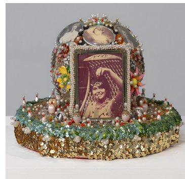
Sarah Pucci Four Generations 1980's

perles, paillettes, épingles, mousse, médaillon ø 30 x 12 cm Unique