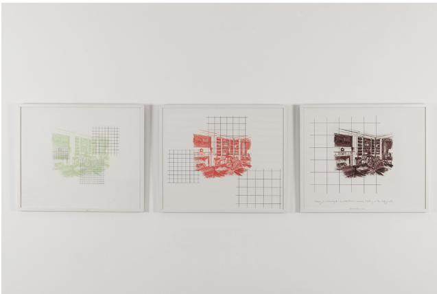
Allen Ruppersberg Honey, I rearranged the collection because poetry is too difficult, 2004 ensemble de 3 sérigraphies rehaussées d'aquarelle encadrées 3 x (79 x 66,5 cm) unique / - +