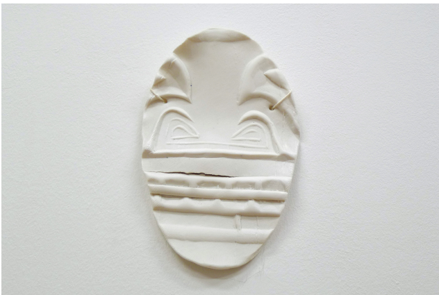
Ingrid Luche Masque sans titre et Polynésie 06, 2016 porcelaine, ficelle coton 25 x 17 x 4 cm unique /- +