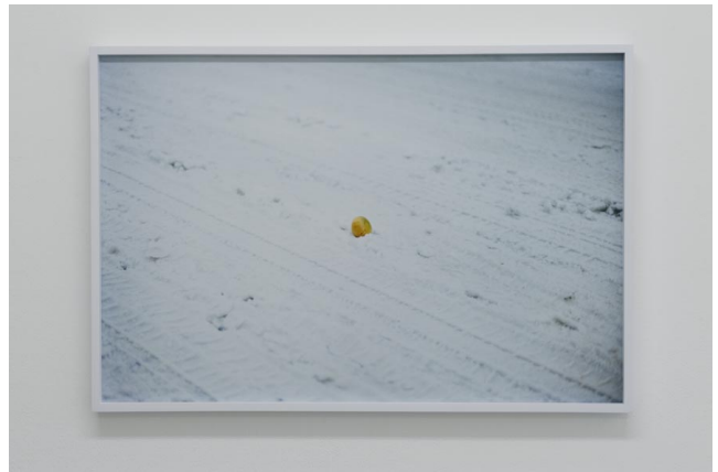
Shimabuku Tangerine, 2010 tirage de type C collé sur aluminium, cadre 55,2 x 81,7 x 4 cm 1/7 + 2ap