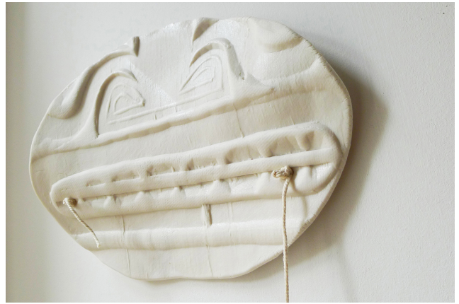
Ingrid Luche Masque sans titre et Polynésie 02, 2016 porcelaine, ficelle coton 26 x 20 x 6 cm unique /- +