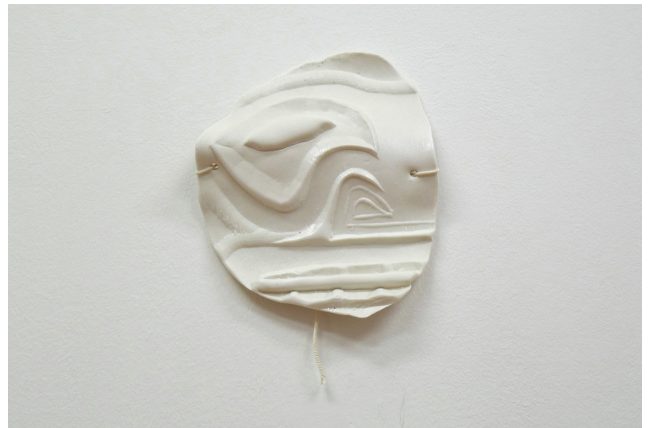
Ingrid Luche Masque sans titre et Polynésie 05, 2016 porcelaine, ficelle coton 22 x 18 x 3 cm unique /- +