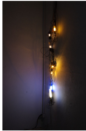
Ingrid Luche Blue Hotel, 2006 montages électriques, ampoules flamme et fluo-compactes, gélatines c. 230 x 45 x 30 cm unique / +