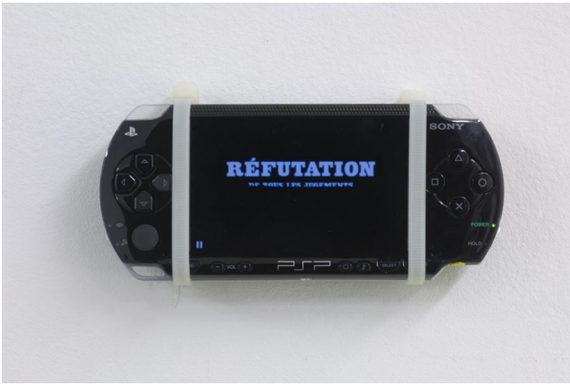
Claire Fontaine Sony PSP playing Guy Debord's La Société du Spectacle (1973) - mute, 2007 Playstation PSP, film mpeg4 (muet), attaches 16,5 x 7 x 2 cm 2/5 + 2ap