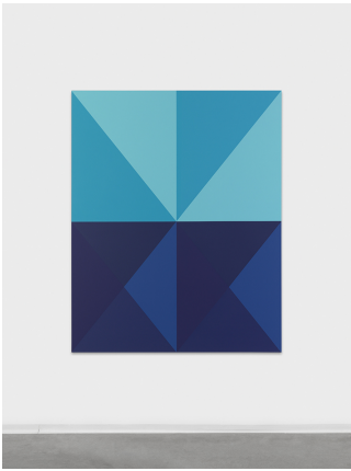
Stéphane Dafflon AST297, 2017 Acrylique sur toile 150 x 120 cm unique// +