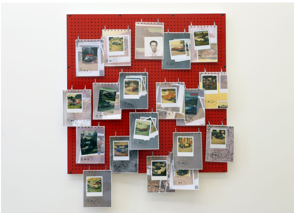
Allen Ruppersberg Three American Collectors / Collections-Cars, 2014 plaque perforée rouge, ensemble de photocopies plastifiées, crochets métal, classeur de photocopies plastifiées supplémentaires. 147 x 125 x 7 cm unique/- +