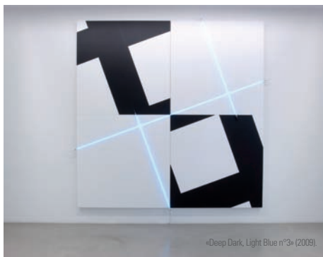
«Deep Dark, Light Blue n°3» (2009).

Depuis 1950, le Choletais développe une abstraction autant influencée par l'art concret et Max Bill que par les motifs ornementaux de l'architecture islamique en Espagne, l'Alhambra de Grenade en tête, et l'aventure Dada. Morellet, qui s'en remet volontiers au hasard et à l'accident avant d'agencer ses formes – c'est le cas pour