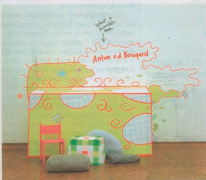
Horrible Man. Grafische meisjesstijl