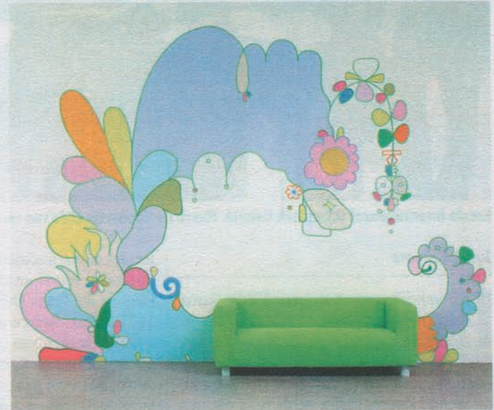
Wall-painting with Green Couch (2003). Absurd soort optimisme

is een absurd soort optimisme dat muren overwoekert. Een lachwekkend soort lichtvoetigheid en onschuld die, vermengd met Van der Stokkers volwassen raffinement en strakke professionaliteit, een ruimte kunnen veranderen.