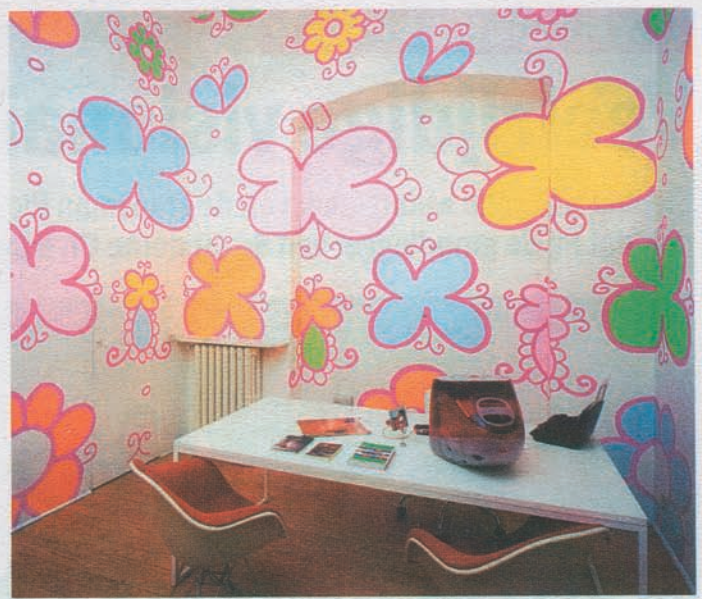
Decoration 2 (2002). Wandschildering in Milanees kantoor