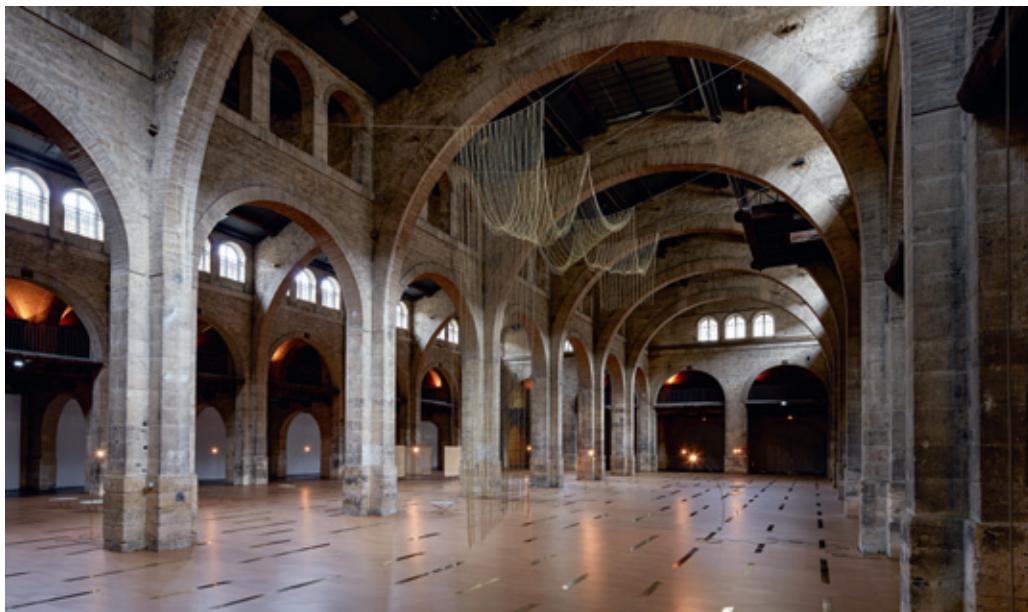
Ci-contre: vue de l'exposition Le Plan flexible , CAPC musée d'art contemporain de Bordeaux. Ci-dessous: Anni #18 (sculpture suspendue), Discrepancies with Lina (tables), Screens (Paravents), Lamps (Lampes) et Discrepancies with Anni (sol), 2015. Au centre: Screens (paravents) et, au sol, Discrepancies with Anni , 2015. En bas: sculpture suspendue Anni # 18 , 2015 (détail), tubes et fils de laiton, environ 22 m.