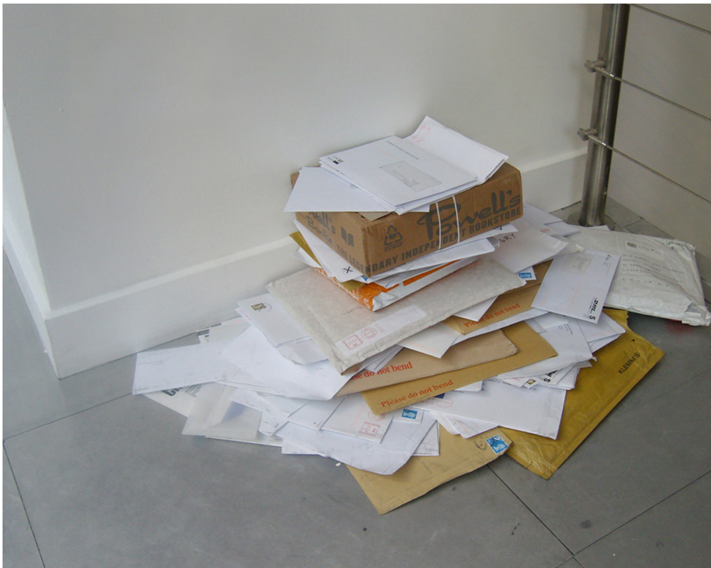
All the best , 2008, Installation view, Wako Works, Tokyo