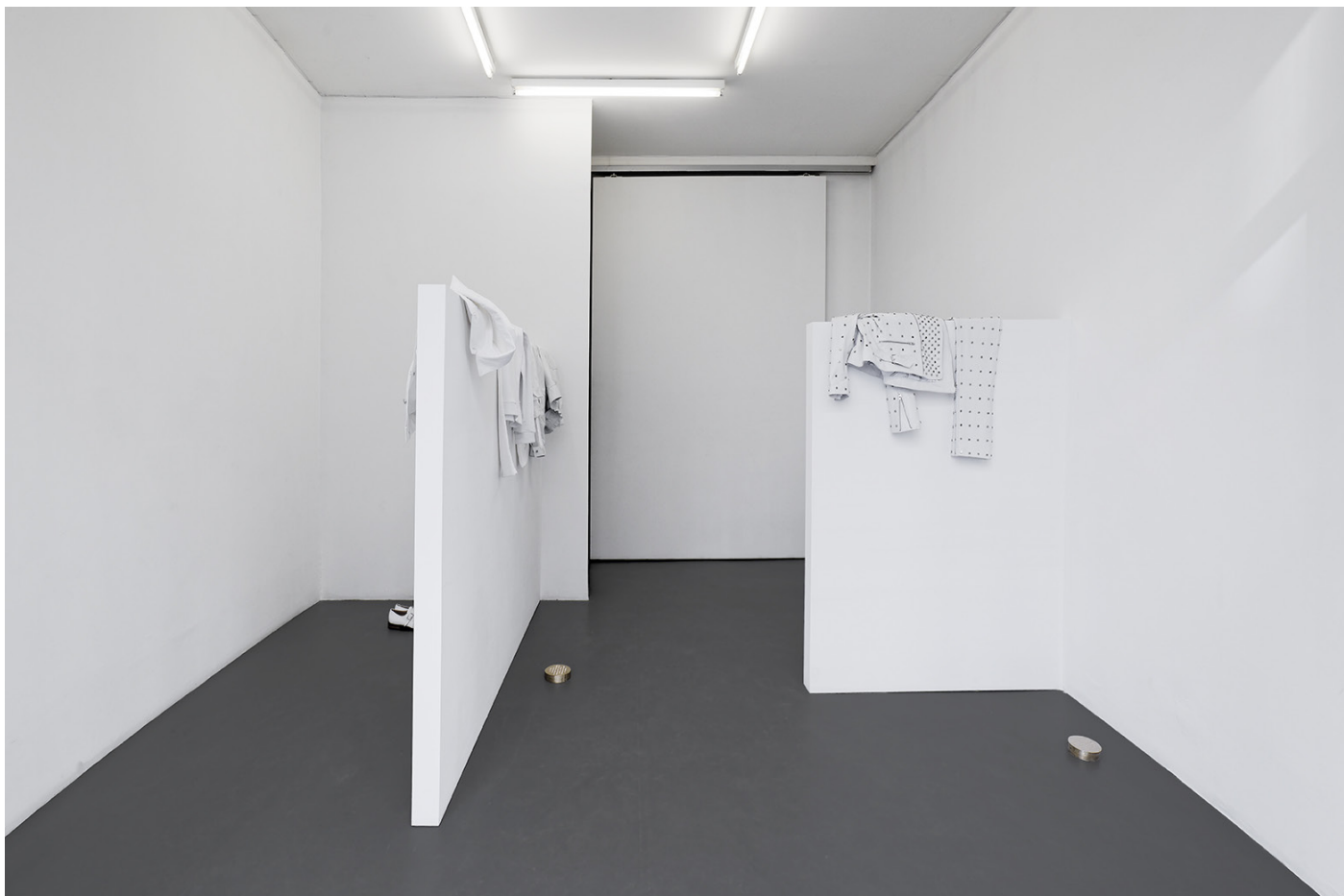
Exhibition view, Trop tard , 2016, galerie Emmanuel Hervé, Paris