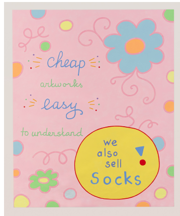
Lily van der Stokker Sock Painting, 2020 Peinture acrylique sur panneau en bois 110 x 90 cm unique/- +