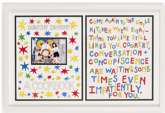
Dorothy Iannone A Cookbook, 2017 diptyque, gouache et encre de Chine sur papier cartonné, cadre bois et verre 37 x 56,2 x 3,4 cm unique/- +