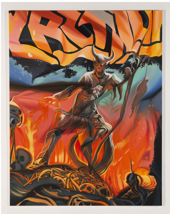
Eliza Douglas Untitled, 2020 huile sur toile, châssis aluminium 209,4 x 163,2 cm unique// +