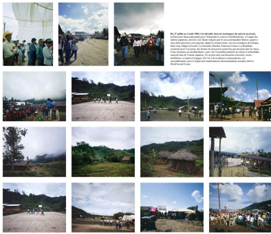
Bruno Serralongue Encuentro (Chiapas 1996), 2004 tirage pigmentaire sur papier Archival, cadre 52 x 62 cm ea1/2 +