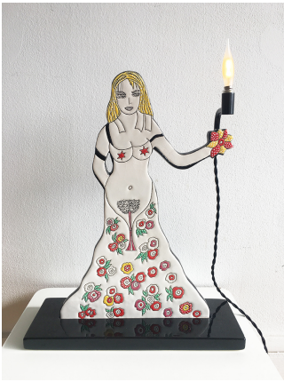
Dorothy Iannone Forever True, 2019 Lampe en céramique, émail cloisonné, laiton. Manufacture des Emaux de Longwy, France. Edition We do not work alone. 40 x 32,5 x 11,5 cm 19/30 + 2AP