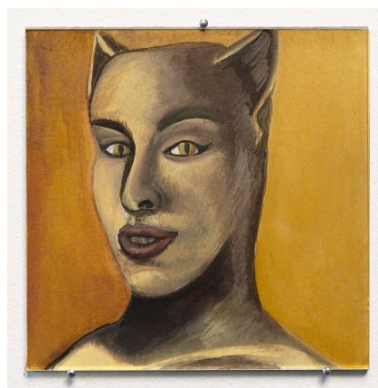
Brice Dellsperger She Cat She, 2017 gouache sur papier unique/- +