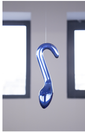
François Curlet Sans titre (Air de Paris Hilton), 2019 verre borosilicate 19 x 7 x 4 cm 2/3 + 1ap