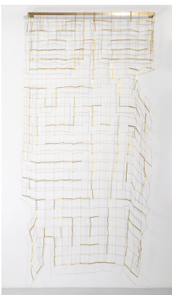
Leonor Antunes anni #26, 2020 laiton 280 x 150 x 20 cm unique/- +