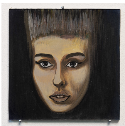
Brice Dellsperger Fire Queen, 2017 gouache sur papier unique/- +