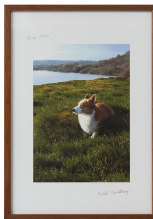
Michel Houellebecq Pelage d'hiver, impression sur papier (2019), signé, cadre 31,2 x 22,6 cm nn/nn +